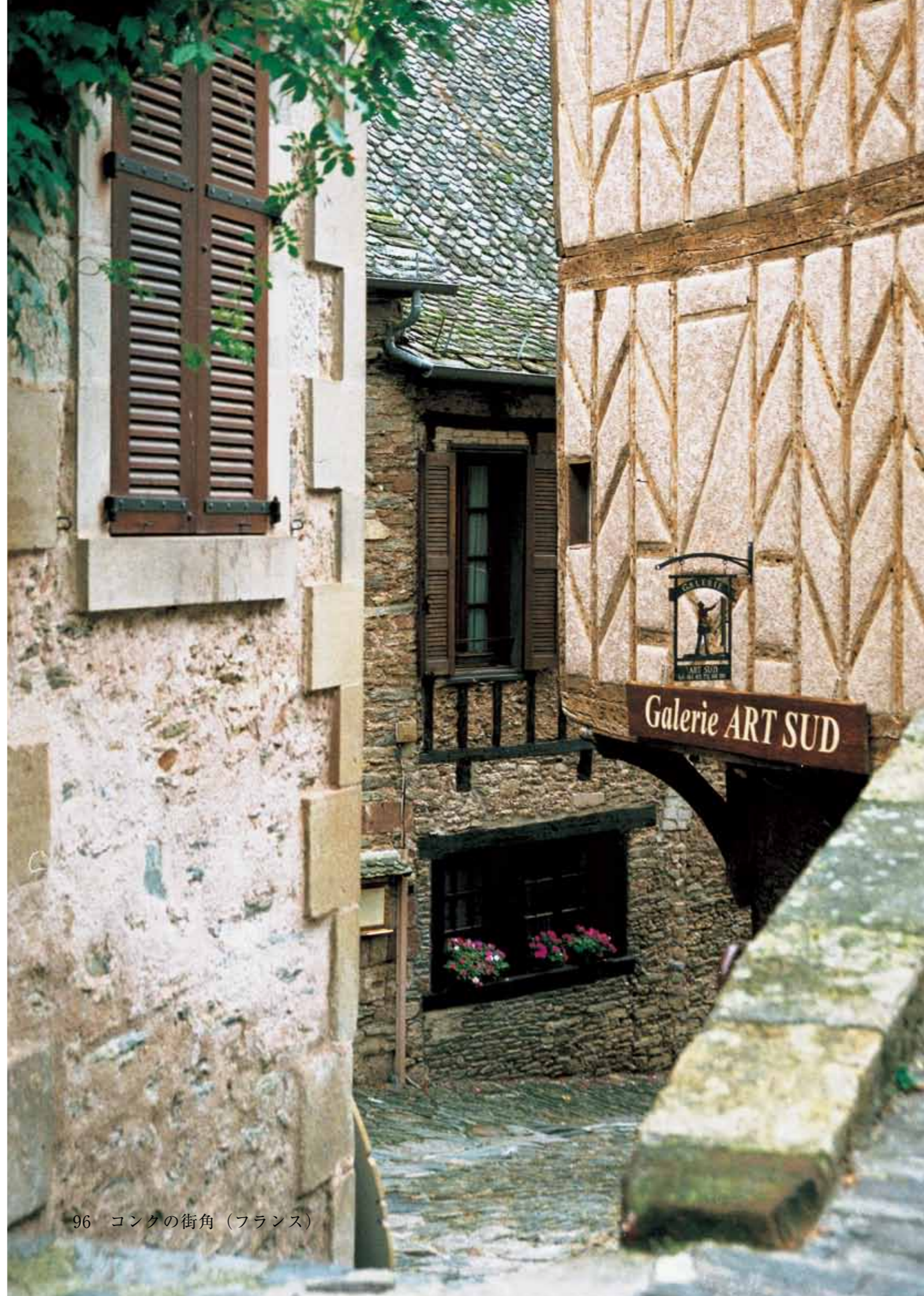
96 コングの街角（フランス）