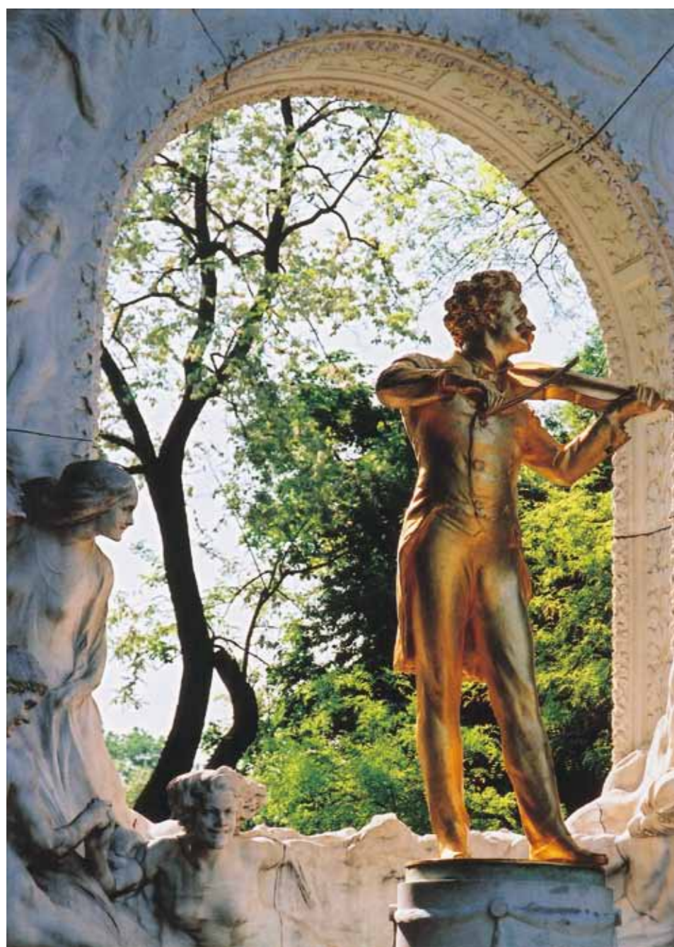
78 ヨハン・シュトラウスの像 (オーストリア)