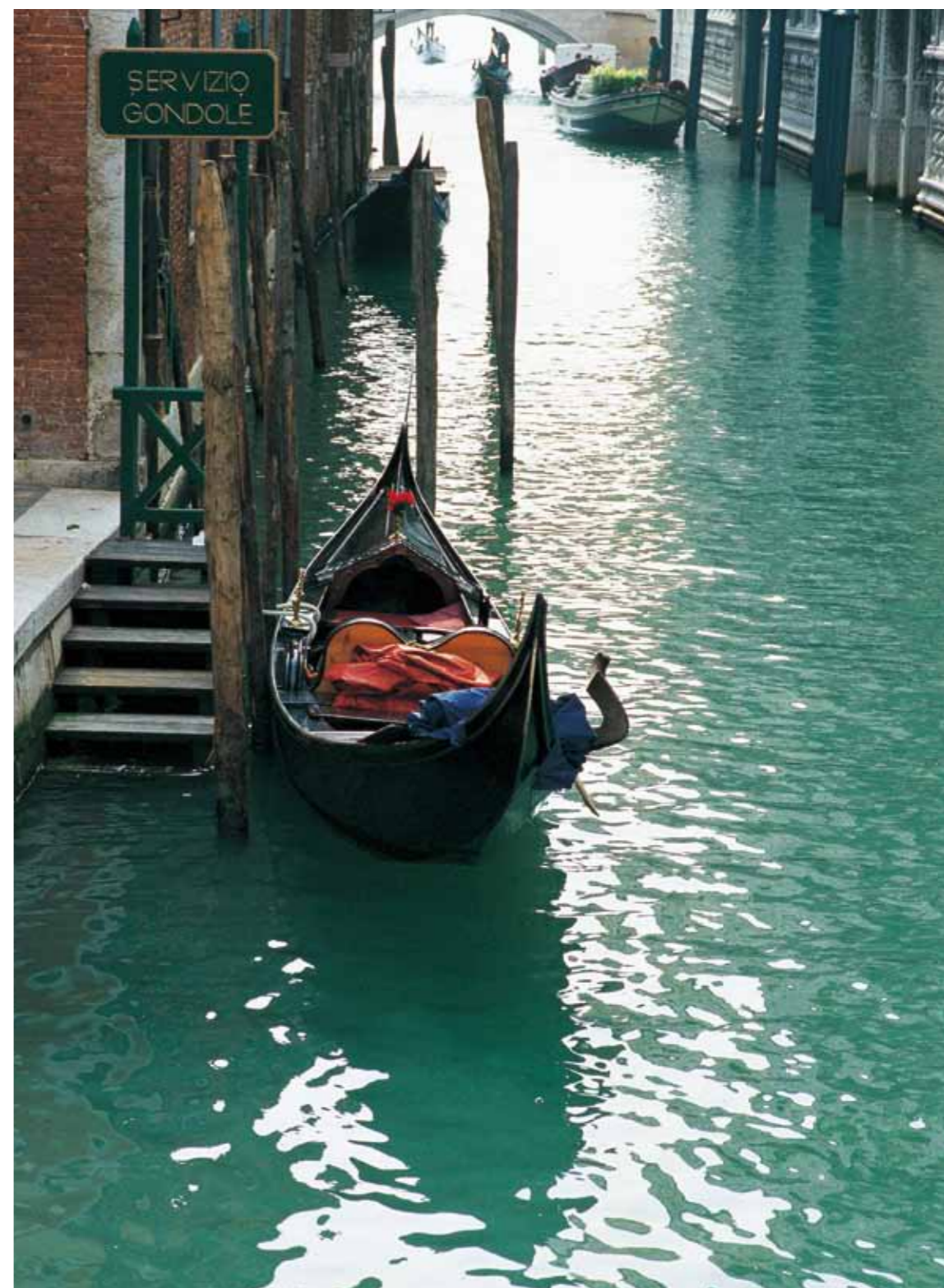
98 サービスゴンドラ（イタリア）