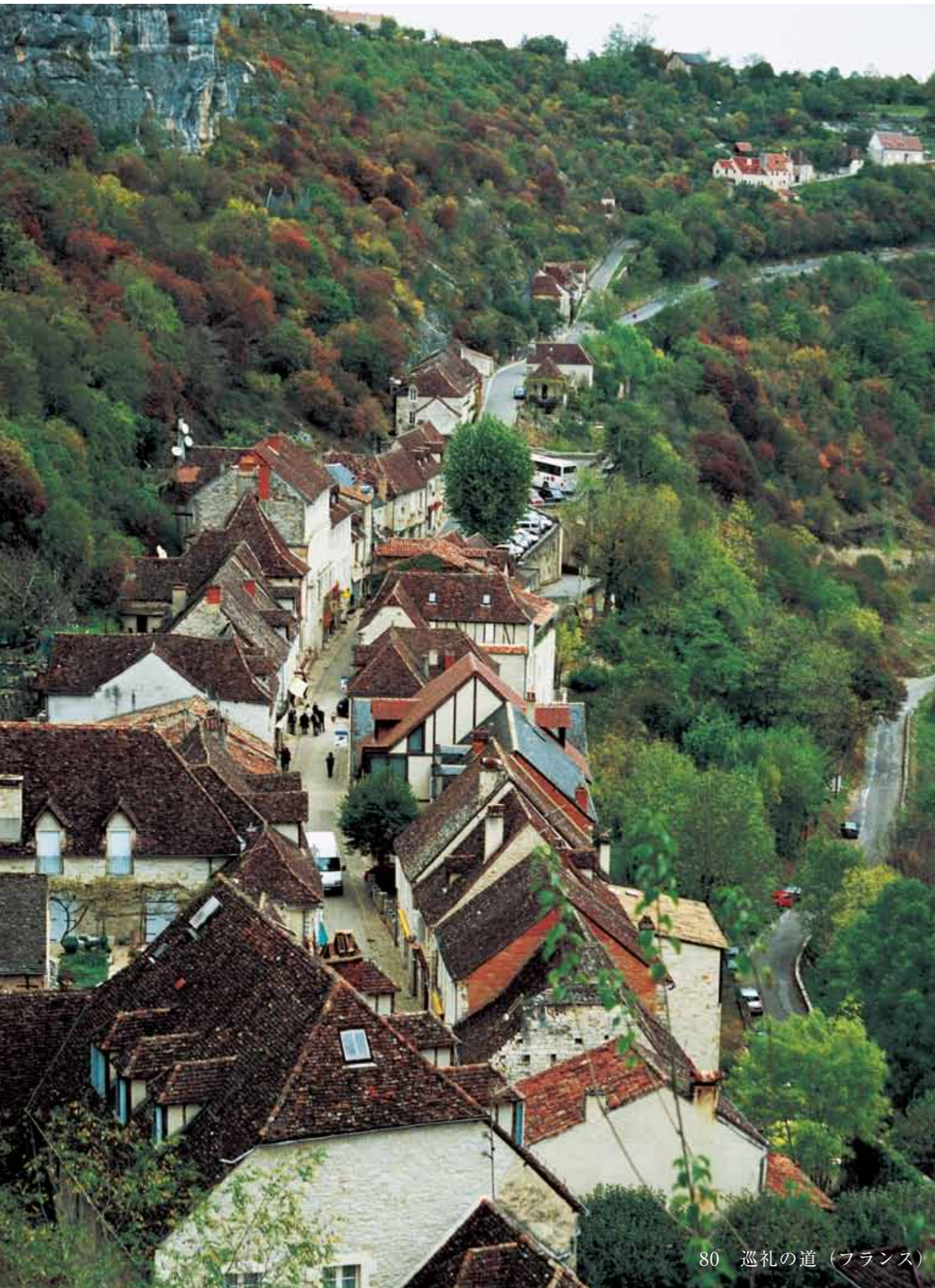
80 巡礼の道 (フランス)