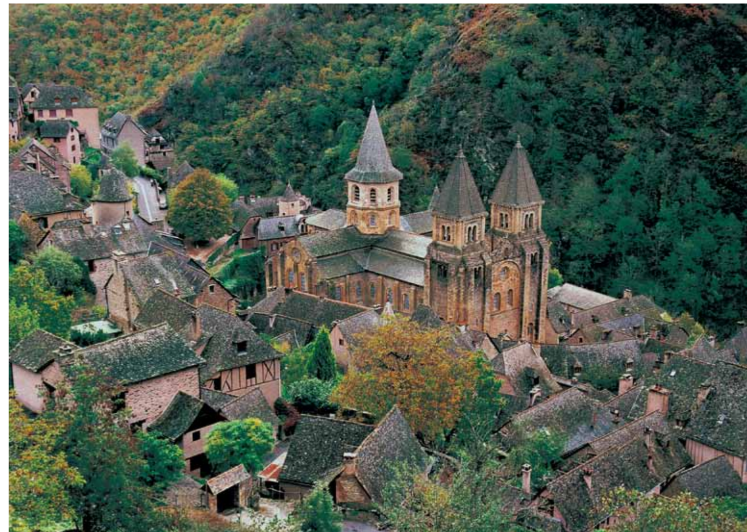
82 コンクのサント・フォワ教会 (フランス)