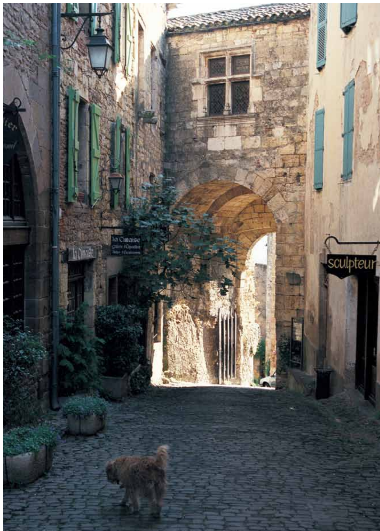
95 サルラの旧市街（フランス）