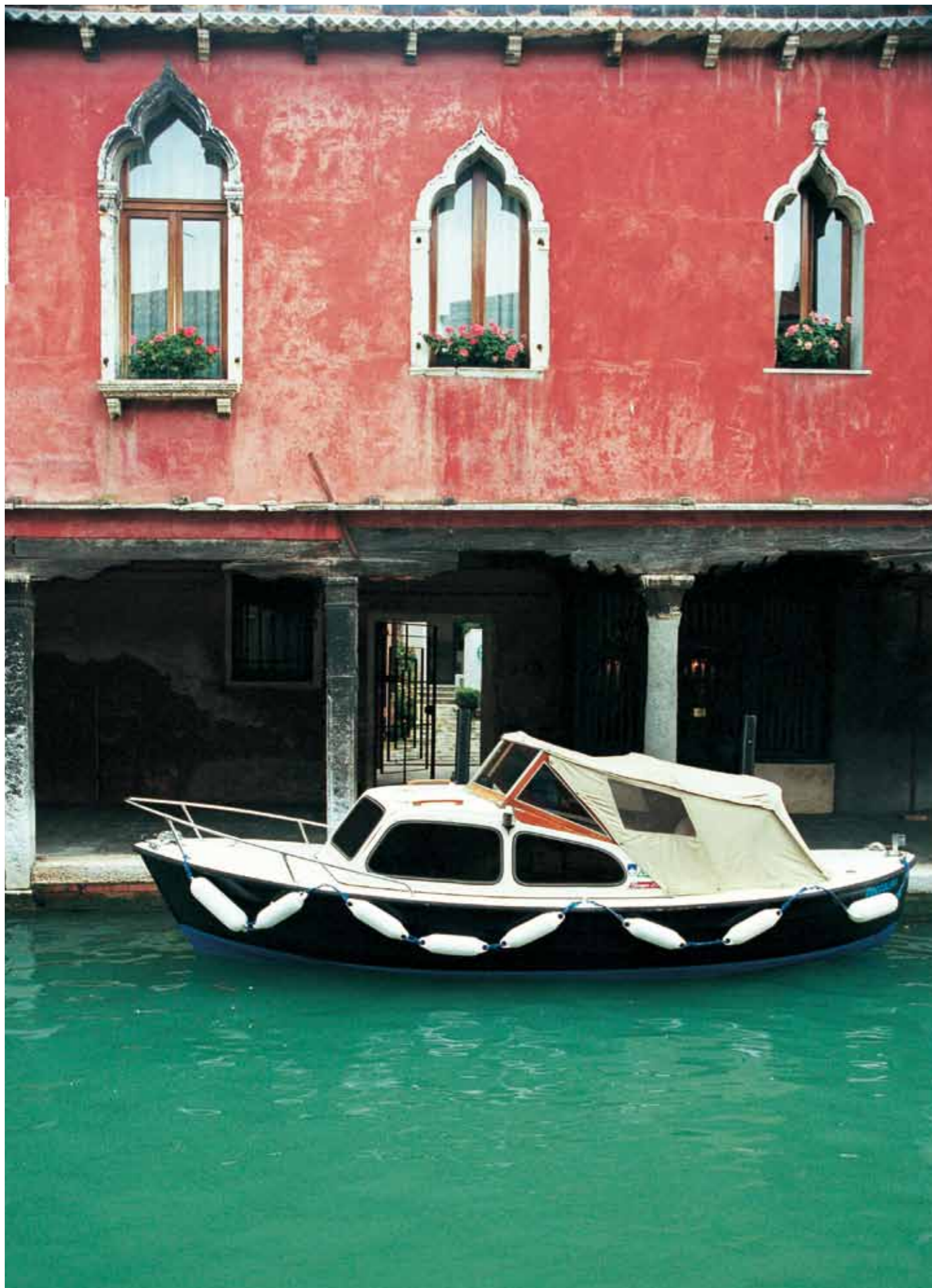
97 ヴェネツィアの海にある玄関（イタリア）